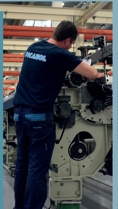
Erkenningsnummer werving en selectie VG 206/B-BHG B-AA04.008 W.RS.98 • lid van Fedegon

Verdonck Professional Partners. Experts in personeelwerving en psychologische screenings.