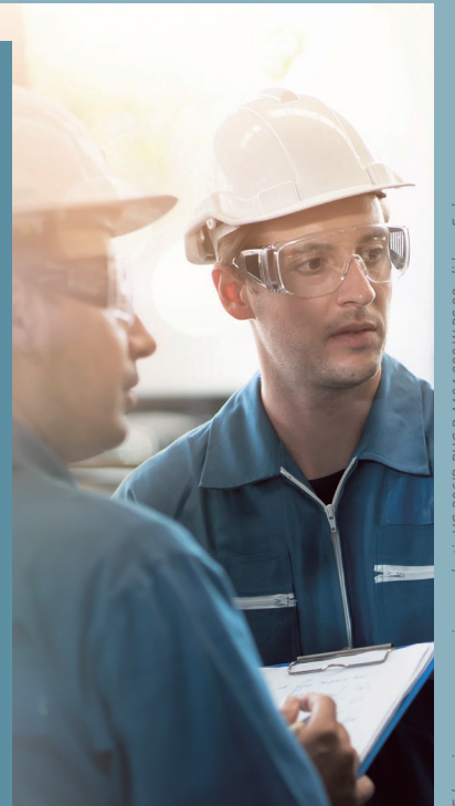
Erkenningsnummer werving en selectie VG 206/B-BHG B-AA04.008 W.RS.98 • lid van Fedegon