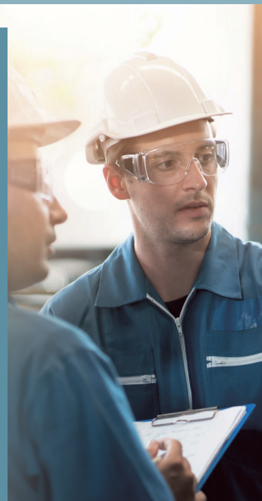
Erkenningsnummer werving en selectie VG 206/B-BHG-B-4A04.008 W.RS.98 • lid van Fedegon

Deze rekrutering verloopt in exclusief contract met hudson