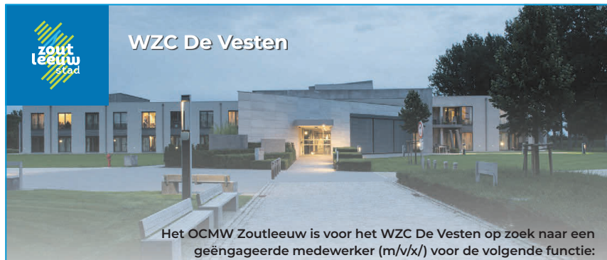
WZC De Vesten

Het OCMW Zoutleeuw is voor het WZC De Vesten op zoek naar een geëngageerde medewerker (m/v/x) voor de volgende functie: